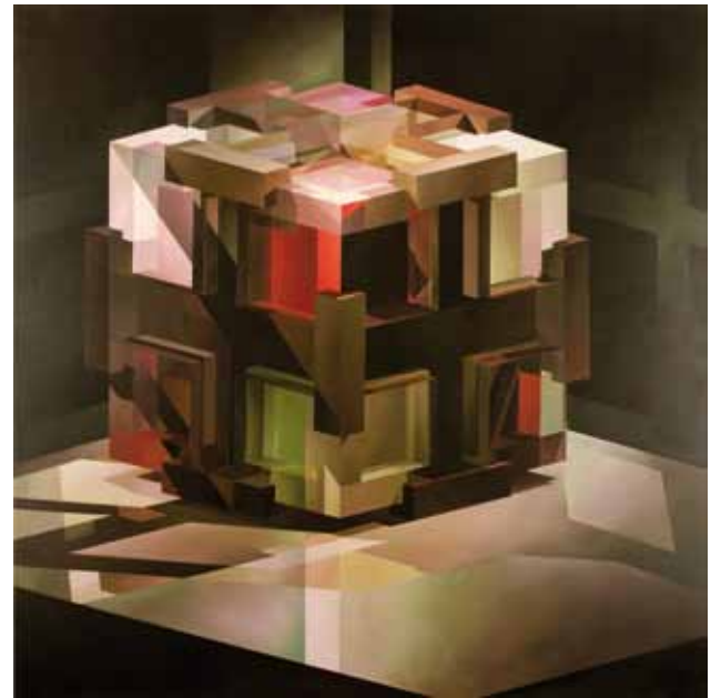
Petra Ottkowski „Würfelkruz im Raum“, 2009, Acryl auf BW, 200x200cm

Öffnungszeiten: Mi. - Fr. + So. 15:00 - 18:00 Uhr, Sa. 10:00 - 13:00 Uhr Informationen unter: www.kunstverein-hockenheim.de , Tel: 06205-6850