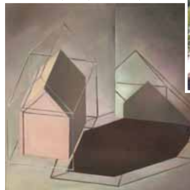
Haus im Haus, 2011, Öl auf Holz, 20x20 cm

E=Einzelausstellung; DA=Doppelausstellung; K=Katalog