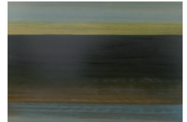
Oben: Peter Lang „Bucht bei Ibanez“, 2011 Öl auf Leinwand, 200x285 cm